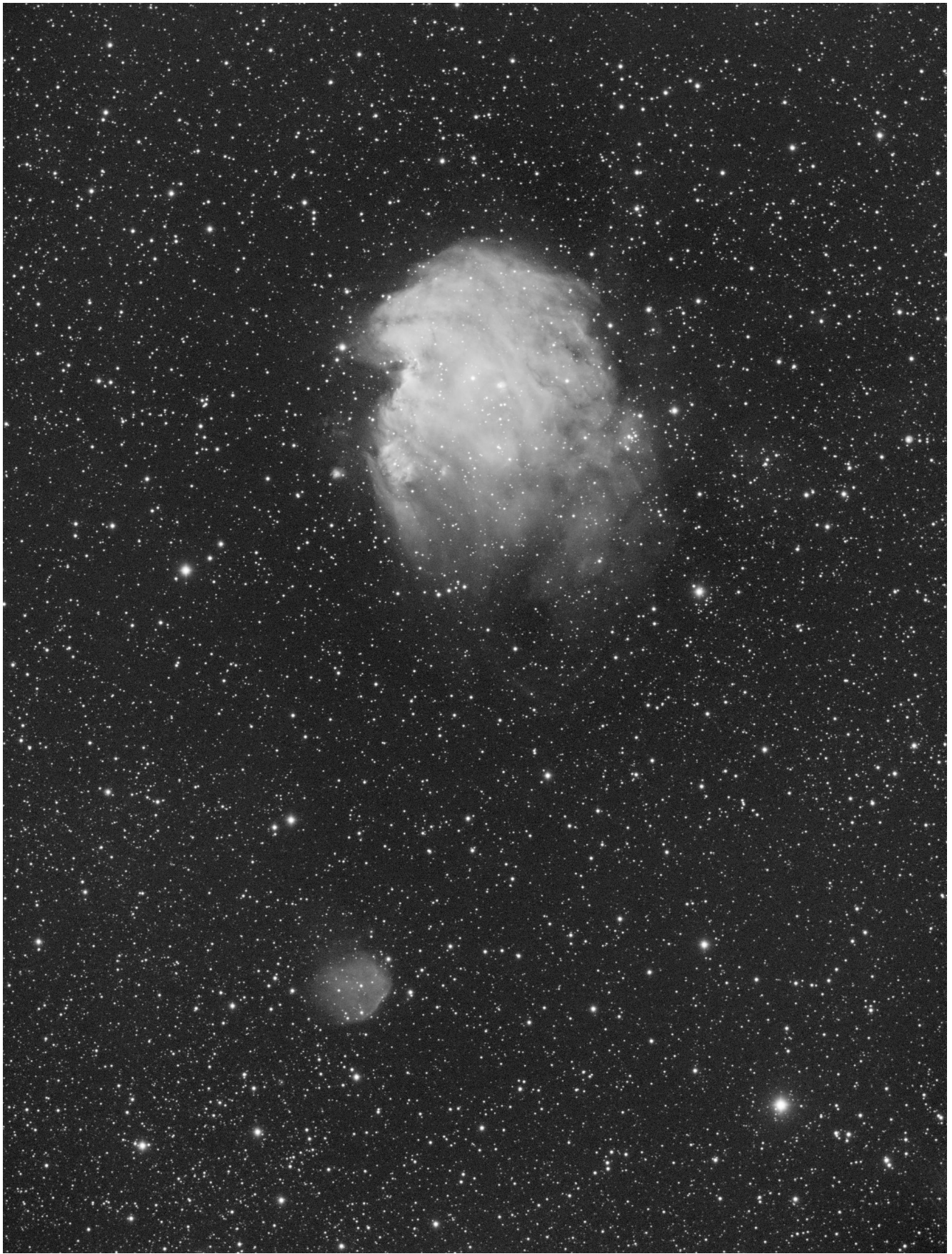
NGC 2174 e Sh2-247 (telescopio/telescope #1) – 01/03/2022