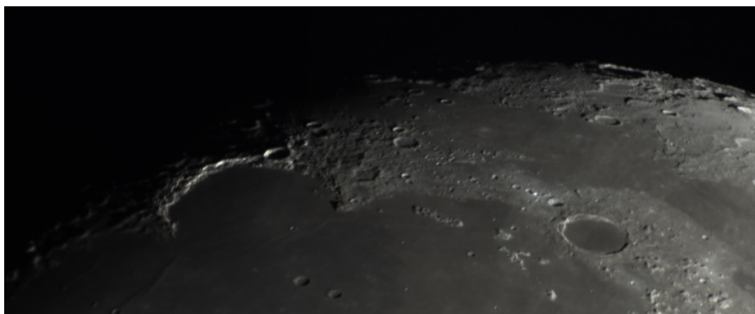
Montes Alpes - 25/04/2018

della stessa per evidenziare le Alpi lunari.