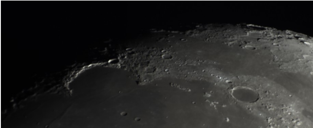
Montes Alpes - 25/04/2018

della stessa per evidenziare le Alpi lunari.