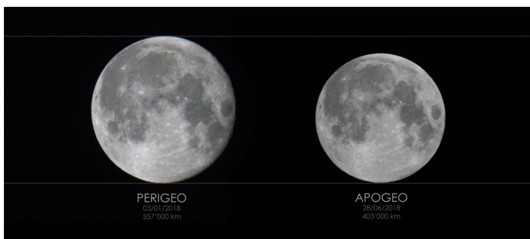
Figura 3: dimensione apparente della Luna Piena durante il perigeo e l'apogeo

variano generalmente tra i 33.2 e i 29.5 minuti d'arco come visibile in figura 3. Nel caso in cui la Luna Piena si trovi in prossimità di un perigeo o l'apogeo con valori estremi, si parla rispettivamente di Superluna e Miniluna. La Luna Piena del 27 luglio 2018 sarà una Miniluna con un diametro di 29.3 minuti d'arco. Keplero dimostrò che in un'orbita ellittica i corpi celesti si muovono più lentamente in prossimità dell'apogeo e più velocemente al perigeo. Come conseguenza la Luna del 27 luglio si muoverà molto lentamente rendendo l'eclissi la più lunga del secolo.