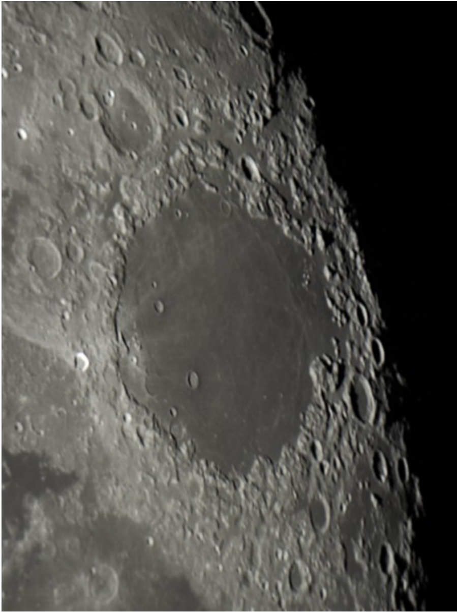
Mare delle Crisi - 15/11/2016