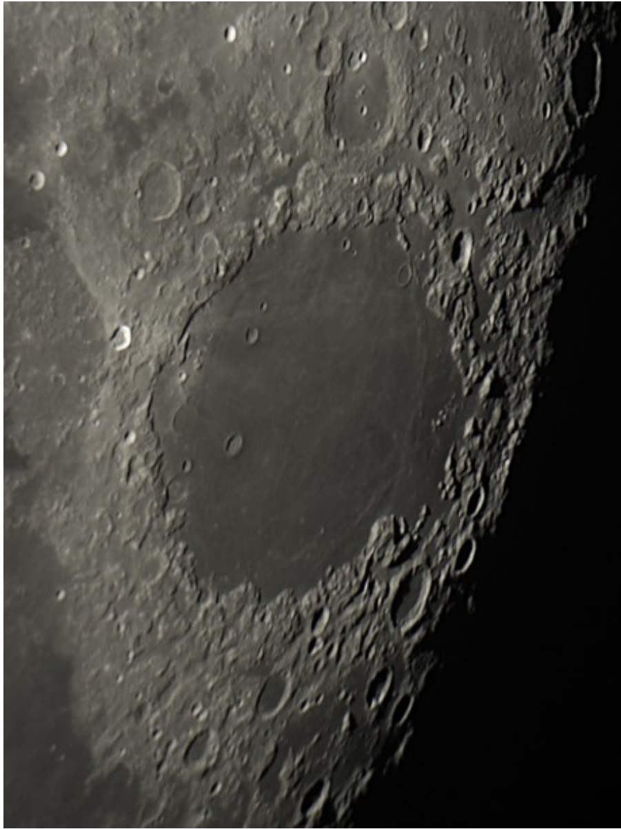
Mare delle Crisi - 15/11/2016