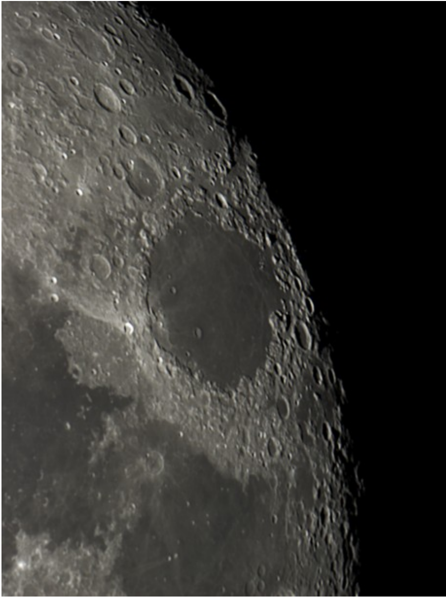
Mare delle Crisi - 15/11/2016