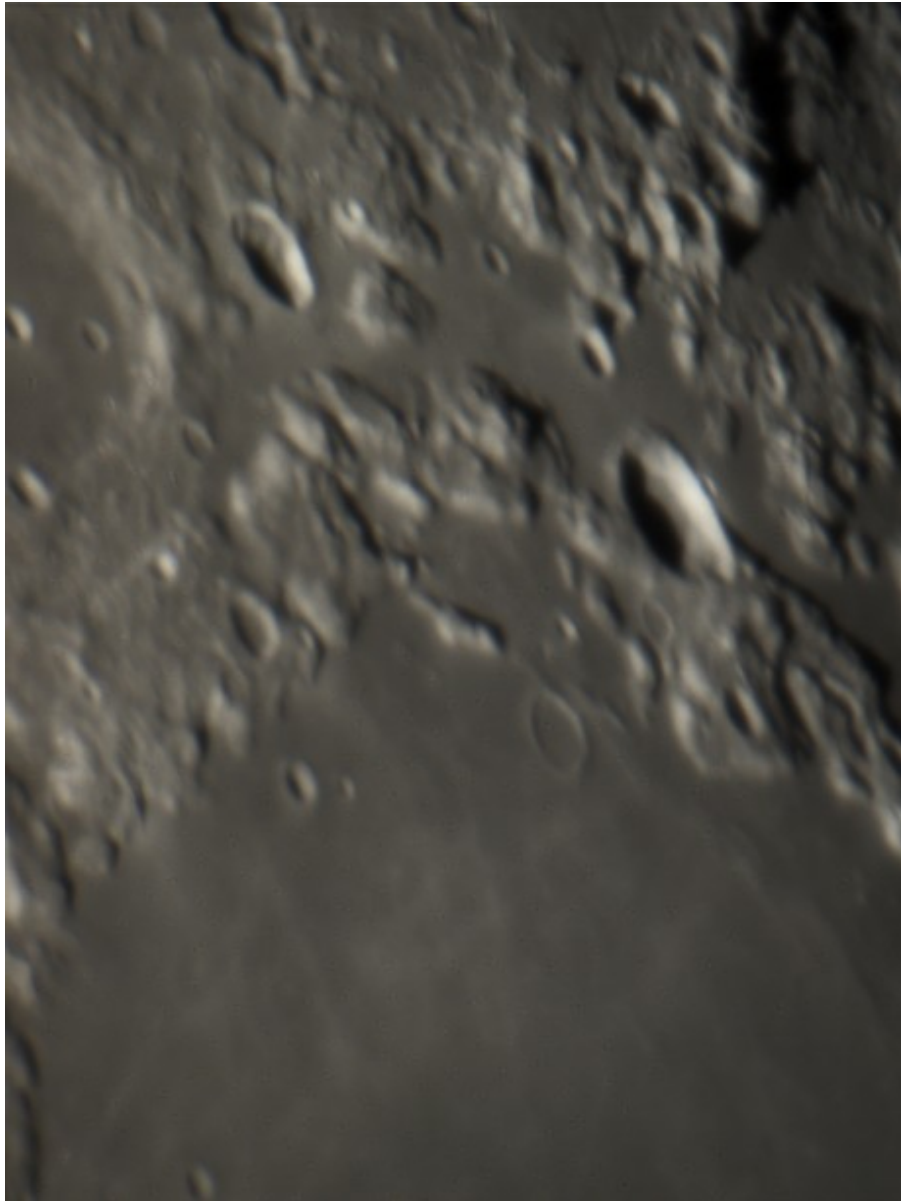
Mare delle Crisi - 15/11/2016 , zoom