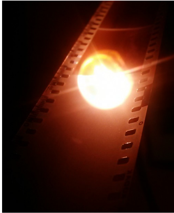
Figura 2: il formato 135, il più diffuso nel mondo della fotografia analogica amatoriale e semi-professionale.

La stessa varietà di forme e rapporti presenti nell'ambito della fotografia tradizionale si riflette nella fotografia astronomica dove i formati più diffusi sono stati riportati in Tabella 1. Le dimensioni dei sensori così come quelle degli elementi fotosensibili che li costituiscono determinano anche il fattore crop e quindi il loro utilizzo. Ecco quindi che sensori molto piccoli e con un'elevata densità di pixel vengono utilizzati nelle riprese planetarie al fine di massimizzare l'ingrandimento ottenuto dall'ottica mentre grandi sensori con pixel molto grandi sono preferibili per la fotografia astronomica DeepSky dove invece è richiesta alta sensibilità alla debole luce proveniente da oggetti lontani oltre che ad un grande campo per riprenderli nella loro interezza. Per maggiori informazioni sull'effetto crop consigliamo la lettura dell'articolo " il fattore di crop ".