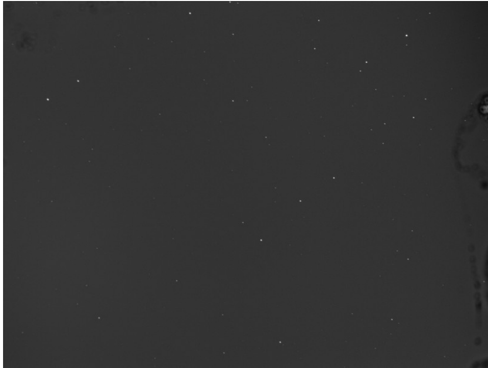
21 Lutetia - 25/08/2015

Note (note): Singolo frame ottenuto con PixInsight + Photoshop con indicata la posizione dell'asteroide. Video realizzato come sequenza di frame con PixInsight e Windows Movie Maker 2012. Infine riduzione effettuata con Astrometrica.