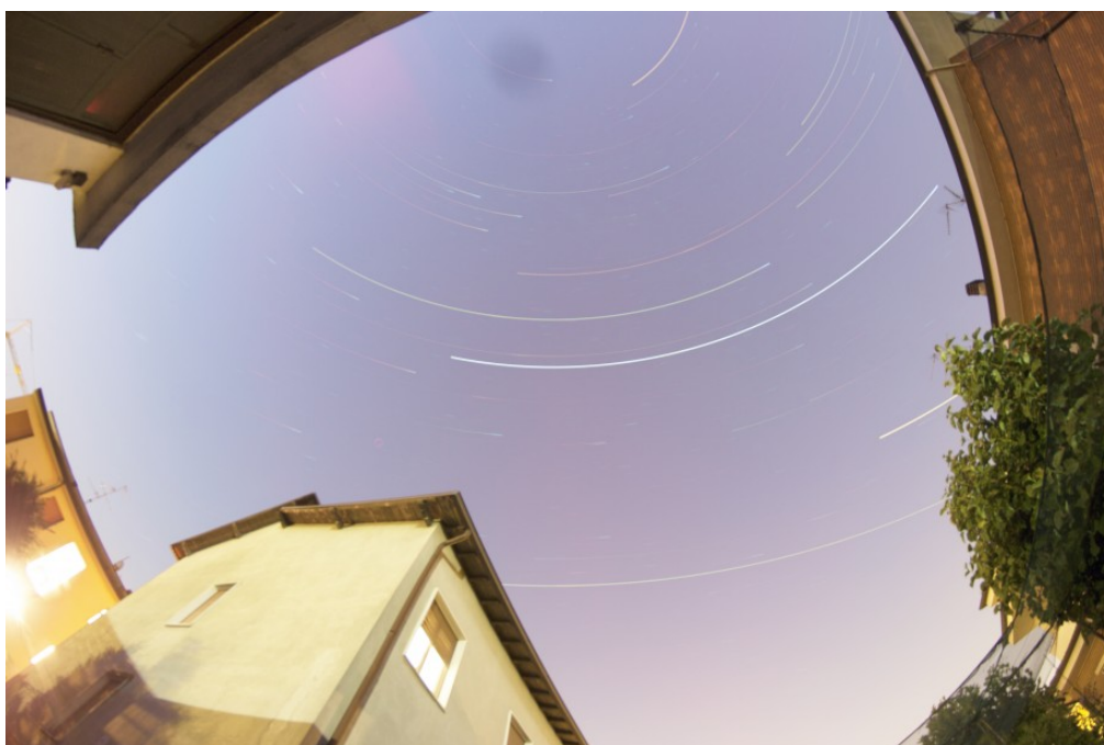
Figura 2: somma delle immagini utilizzate per lo studio dell'inquinamento luminoso all'Osservatorio Astronomico Smeraldino.

In ogni caso, la misura effettuata ha mostrato la validità del metodo utilizzato. La stessa verrà ripetuta in autunno e/o inverno in condizioni di luna nuova o calante. Inoltre lo stesso metodo potrà essere utilizzato per misure di inquinamento su scala stagionale al fine di identificare i fattori che influenzano la qualità del cielo. A titolo puramente qualitativo riportiamo in figura 2 la somma delle pose effettuate durante la misura.