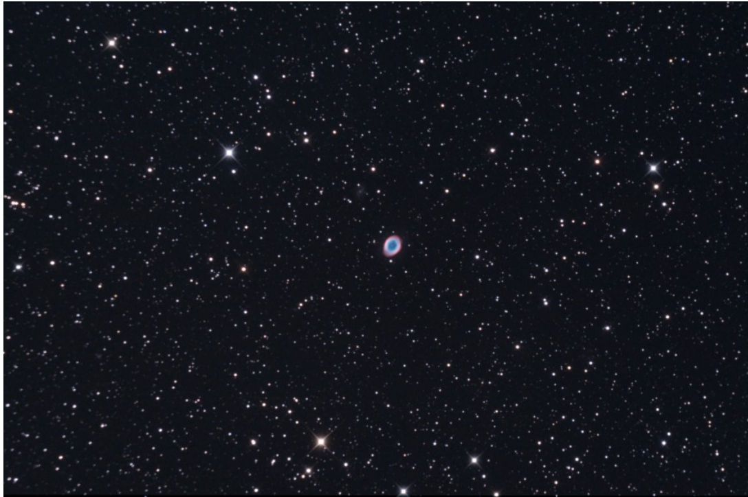
M57 (NGC 6720) - 24/05/2014 | Immagine originale

Note (note): Riportiamo l'immagine originale ed un crop per ridurre il coma residuo dell'RC / We report the original picture a crop version in order to exclude the RC residual coma.