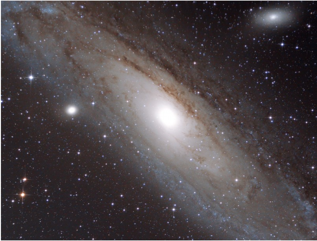
M31 (NGC 224) - 29/12/2013 (composizione LRGB)