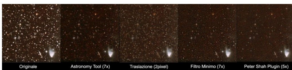
Fig. 4: Confronto tra l'applicazione limite dei quattro metodi illustrati in questo articolo per

Il confronto tra i metodi discussi in questo articolo non può però fermarsi qui. Infatti un altro fattore importante nella scelta di un metodo di riduzione dei diametri stellari è quello relativo all'elasticità del metodo utilizzato. Infatti il diametro ottimale delle stelle non esiste ed è a discrezione dell'autore. In questo senso un metodo che permette di ridurre i diametri stellari in modo progressivo risulta favorito. Alla luce di ciò il metodo della traslazione è molto limitante dato che applicato due volte fornisce un'immagine ricca di artefatti e di scarsa qualità. Abbiamo quindi spinto al limite i metodi discussi al fine di testare quando il metodo utilizzato comincia a creare degli artefatti che vanno ad inficiare la qualità dell'immagine. In Figura 4 è illustrato il risultato del test.