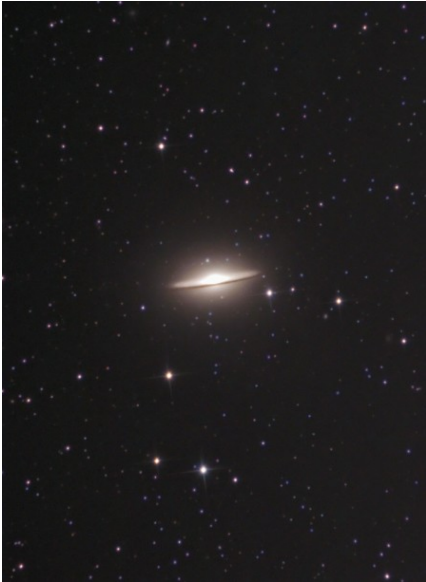
M104 (NGC 4594) - 13/04/2013

Note (note): LRGB. Magnitudine limite compresa tra +20 e +21 (maximum magnitude +20/+21).