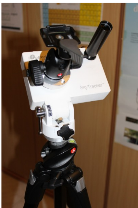
Figura 1: l'astroinseguitore iOptron SkyTracker.

Lo iOptron SkyTracker è confezionato in una scatola di cartone sigillata da nastro adesivo. Al suo interno troviamo una borsetta che contiene il manuale di istruzione, l'astroinseguitore (nel caso in esame di colore bianco) ed il cannocchiale polare opportunamente sigillato e contenuto in un'apposita tasca interna. Borsetta comodissima per l'eventuale trasporto dello strumento in completa sicurezza. Analizziamo ora l'astroinseguitore (Figura 1).