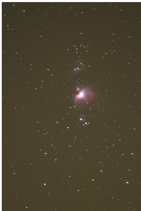
Figura 3: Nebulosa di Orione a 300mm di focale. Lo scatto da 5 minuti di posa mostra un mosso evidente.

differenti, ovvero non più grandangolari ma a focale spinta pari a 300mm. La ditta madre assicura un buon inseguimento fino a focali pari a 200/250 mm, quindi andando a 300mm siamo andati oltre al fine di scoprire cosa iOptron intende con inseguimento "buono". Ecco quindi una ripresa della nebulosa di Orione ripresa ad f/6.4, sensibilità 400ISO e 300 secondi di posa. Come potete notare dalla Figura 3, lo scatto presenta un visibile mosso.