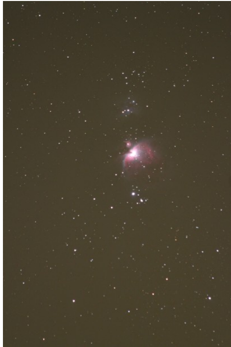
Figura 4: Nebulosa di Orione a 300mm di focale. Lo scatto da 2 minuti e mezzo di posa non mostra più il mosso evidente in Figura 3.