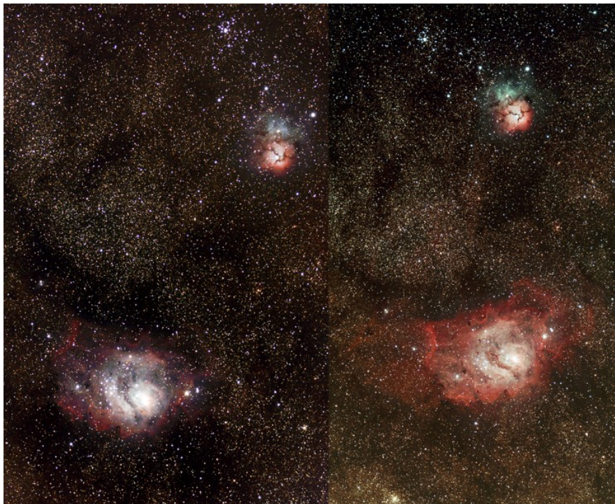
Figura 2: Un confronto tra due immagini della nebulosa M8 ed M20 nel Sagittario riprese con una Canon EOS 500D originale (immagine di sinistra) e modificata (immagine di destra).

Cosa possiamo dire riguardo i pixel verdi e blu? Come influisce la modifica su questi tipi di pixel? La risposta è semplice e la trovate nella figura 1 dell'articolo "Efficienza Quantica" . La modifica Baader sostanzialmente non modifica l'efficienza quantica dei pixel verdi e blu. Questo si traduce nel non avere nessun tipo di guadagno in luminosità per oggetti di quel colore. Pertanto, riprendere nebulose come quella che circondano le Pleiadi o galassie come la Grande Galassia di Andromeda, con filtro originale o Baader, non comporta nessuna differenza.