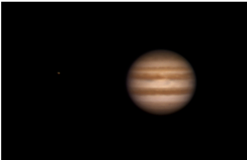
Giove - 19/12/2012 - il satellite in figura è Io