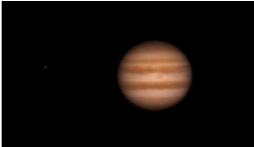
Giove - 19/12/2012 - il satellite in figura è Io

Focale equivalente (Equivalent focal length): 4360 mm