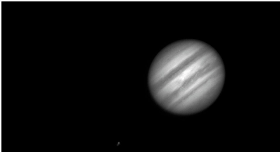
Giove - 19/12/2012 - il satellite in figura è Io

(clicca qui per scaricare le immagini originali in formato TIFF – click here in order to download the TIFF files)