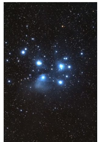
M45 - ammasso aperto delle Pleiadi

Intorno alle galassie abbiamo spesso anche la condensazione contemporanea di altre piccole nube di gas che danno luogo a quegli ammassi noti come ammassi globulari .