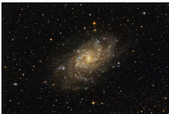
M33 - Esempio di galassia a spirale

Questo gas “sporco” va così a contaminare l’Universo. Stelle che nasceranno dalla contrazione di questo gas partiranno con degli elementi pesanti al loro interno oltre ai sempre abbondanti Idrogeno ed Elio. Tali stelle prendono il nome di stelle di “seconda” generazione. Una stella di questo tipo è ad esempio il nostro Sole . Nel Sole infatti troviamo tracce di elementi pesanti, tra cui il Ferro, necessariamente sintetizzati in passato nel cuore di una stella (più massiva) poi esplosa.