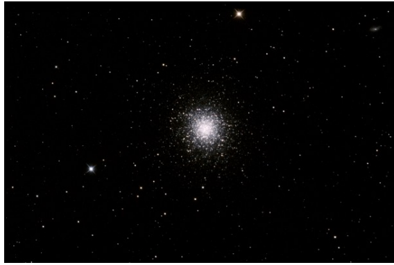
M13 – Esempio di ammasso globulare

Intorno alle galassie abbiamo spesso anche la condensazione contemporanea di altre piccole nube di gas che danno luogo a quegli ammassi noti come ammassi globulari .