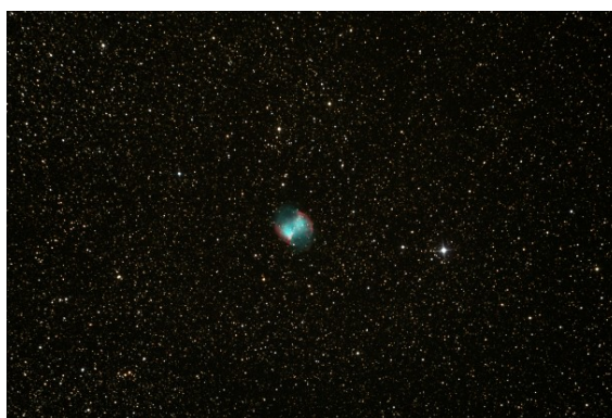
M27 - Esempio di nebulosa planetaria

Tutte le stelle che osserviamo nel cielo si trovano in questo stato. Una volta giunte alla fine della loro vita (ovvero sintetizzato l'elemento più pesante permesso), queste possono o spegnersi dolcemente rilasciando nello spazio il gas che le costituisce oppure esplodere violentemente dando luogo a quei fenomeni noti come esplosioni di supernova . Nel primo caso, l'oggetto che possiamo osservare con i nostri telescopi è un ammasso di gas sferico con al centro quel che rimane del nucleo stellare (nana bianca). Questo tipo di nebulosa è detta nebulosa planetaria .