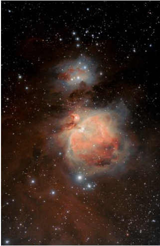
M42 - Nebulosa di Orione

buio, senza stelle, riempito da immense nubi di Idrogeno ed Elio.