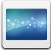
IMG_0039.CR2 21,8 MB dom 19 ago 2012 02:31:41 CEST

Alcune DSLR permettono il salvataggio RAW + JPEG, utile per visualizzare velocemente le informazioni contenute nel file RAW