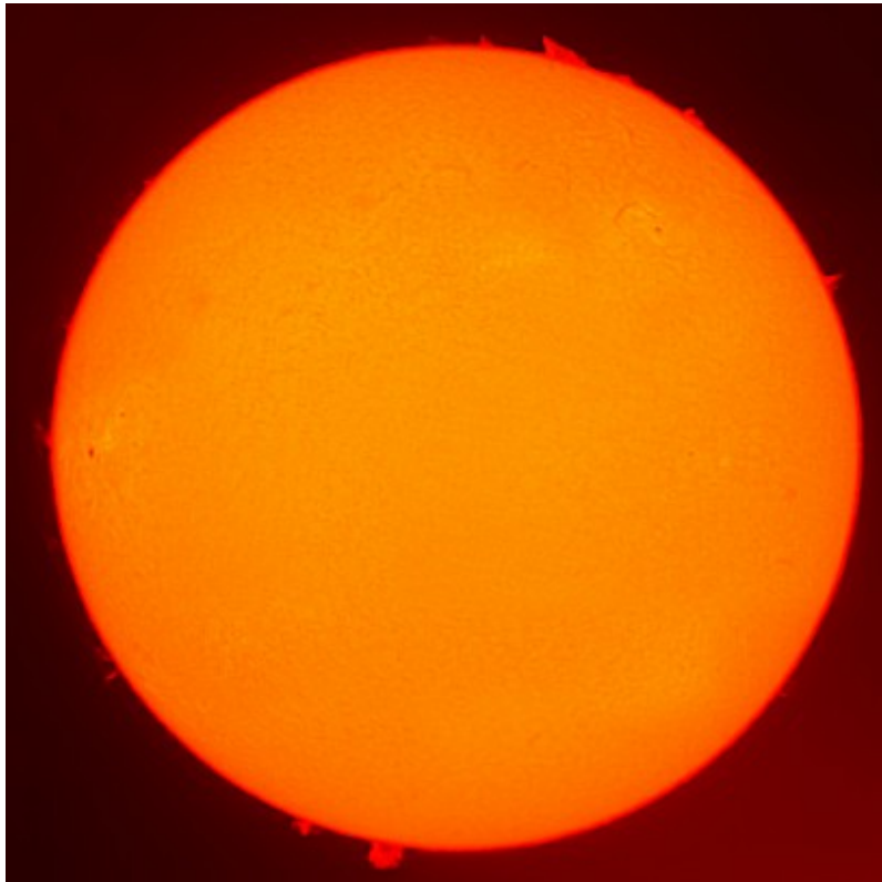
Disco solare in H-alfa - 13/03/2012

somma di 13 immagine, ciascuna somma di 500 frame. Telescopio LUNT 60mm BF1200 + camera Celestron Nextimage + filtro IR-cut. Elaborazione effettuata con Registax + Photoshop. Riportiamo anche la versione con disco oscurato al fine di simulare (via software) un'eclissi totale di Sole. ( Clicca qui per l'immagine originale in formato TIFF )