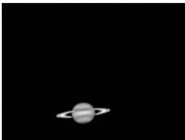
Saturno - 19/04/2011

(Clicca qui per l'immagine originale in formato TIFF)