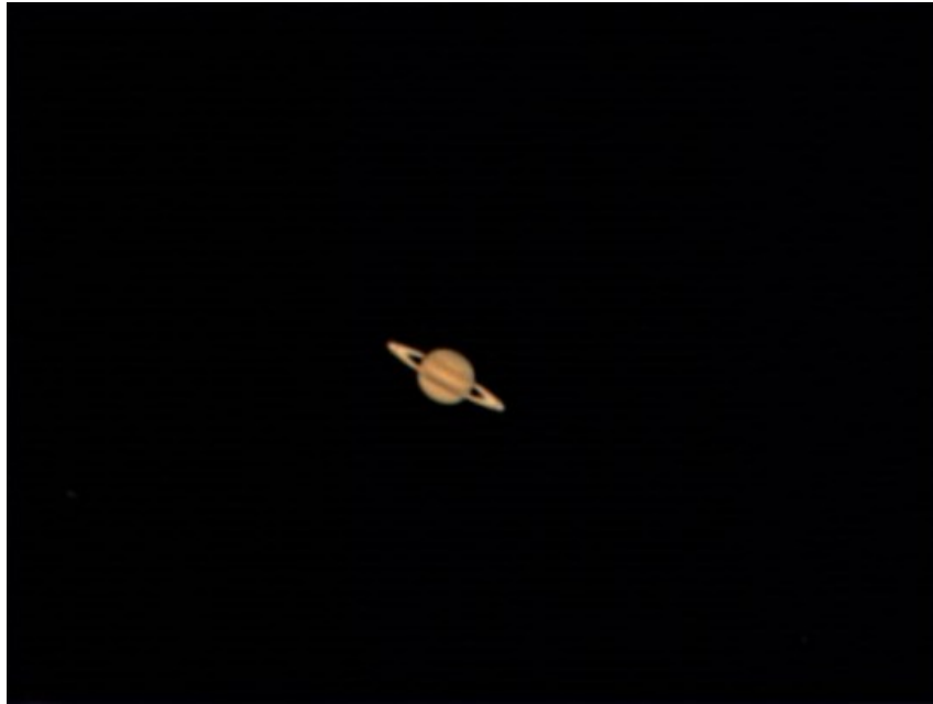
Saturno - 19/04/2011

(Clicca qui per l'immagine originale in formato TIFF)