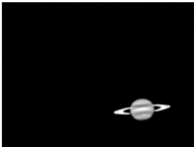
Saturno - 19/04/2011

Infine le immagini del disco planetario in B/W e a colori (con camera Philips SPC900NC).