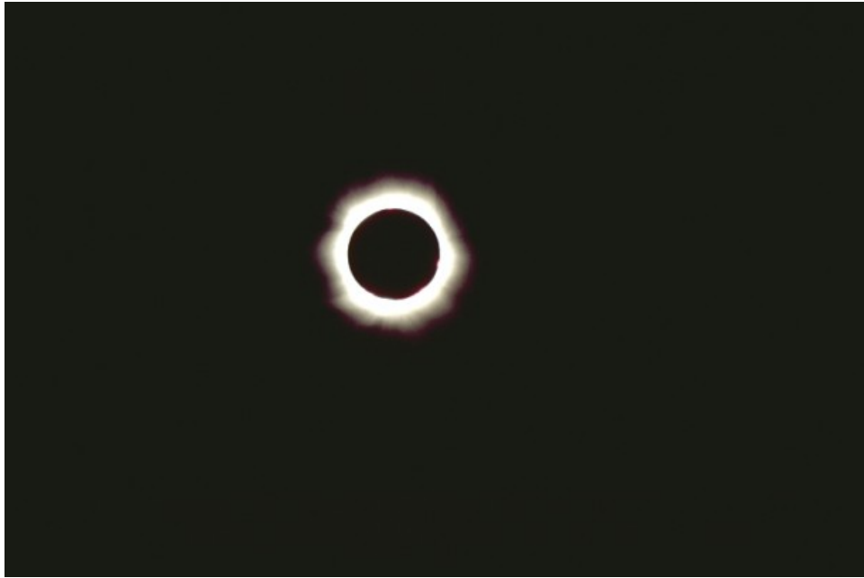
Eclissi Totale di Sole - 11/08/1999