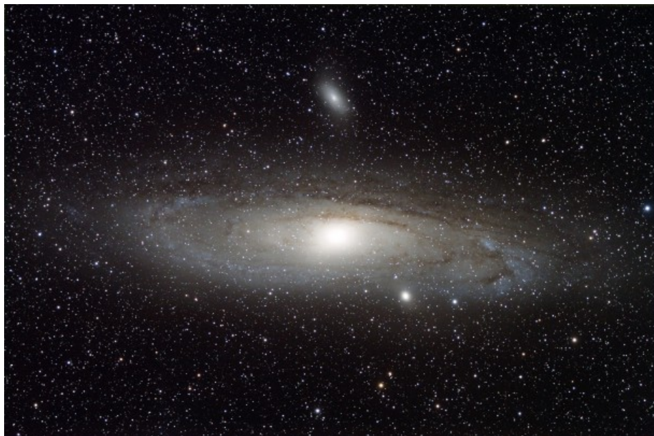
M31 (NGC 224) - 29/08/2011

Dati di ripresa: 30 pose da 6 minuti a 800 ISO (tot. 3.0h) + 10 dark + 56 bias + 57 flat (Geoptik flat generator, effettuati il giorno dopo). Elaborazione IRIS + Nebulosity 2.4 + Photoshop CS2/CS4 ( Clicca qui per l'immagine originale in formato JPG )