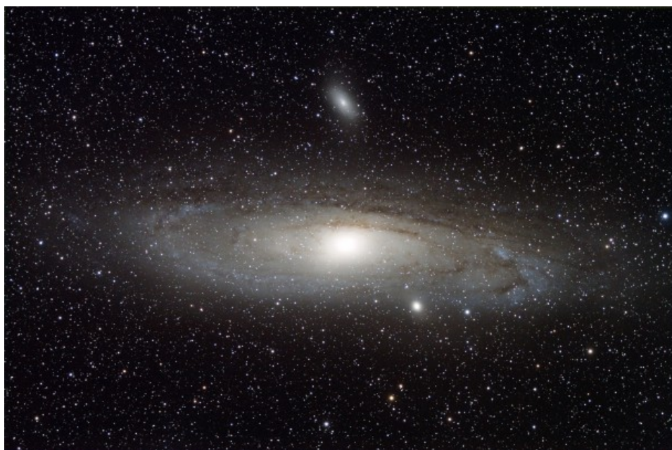
M31 (NGC 224) - 29/08/2011

Dati di ripresa: 30 pose da 6 minuti a 800 ISO (tot. 3.0h) + 10 dark + 56 bias + 57 flat (Geoptik flat generator, effettuati il giorno dopo). Elaborazione IRIS + Nebulosity 2.4 + Photoshop CS2/CS4 ( Clicca qui per l'immagine originale in formato JPG )